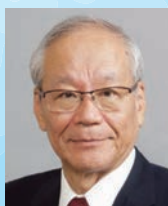
横倉義武共同代表