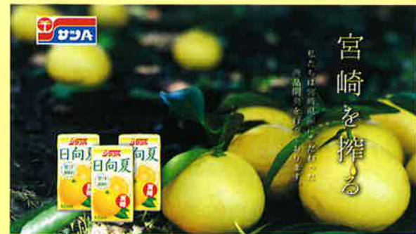
「ひなたビジョンで放映」