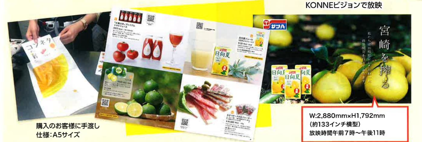
購入のお客様に手渡し 仕様: A5サイズ