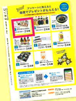
「プレゼントページ」

冊子の裏表紙でアンケートを取っているのでマーケティングも可能です。 アンケート終了後、関係する箇所をまとめてお渡しいたします。(個人情報を除く)