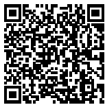
MAPデジタルパンフレット