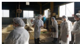
三股町の漬物工場を訪問し研修会

女性経営者、組合事務局役員、個人会員で構成されています。人的交流や情報交換などを通じた人づくりと、会員の資質向上を目指し、各種研修会、交流会等を実施しています。