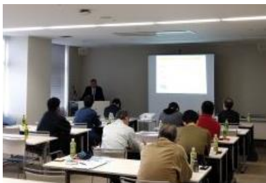
宮崎県味噌醤油工業(協)「知的財産(商標登録)研修」

また、研修会や講習会の開催、専門家への相談、BCP策定、ホームページ作成などに活用できる様々な支援施策を提案しています。