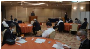
県知事等を招聘し意見交換会

県内の官公需適格組合の証明を得た組合及び証明を得ようとする組合等で構成されています。県内の官公需適格組合の受注体制の整備拡充と技術力の向上を図り、受注機会の確保を推進し、会員組合の振興発展に寄与することを目的に研修会や意見交換会等を実施しています。