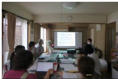
(企)介護福祉サービスひばり「BCP策定研修」