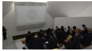
県外視察研修(長野県の企業を訪問)

食品産業や生産者、試験研究機関等との連携促進を通じた県内食品産業の発展を目的として、効果的な新商品開発や販路拡大に繋がる研修会・セミナー等を実施するなど様々な取組を行っています。