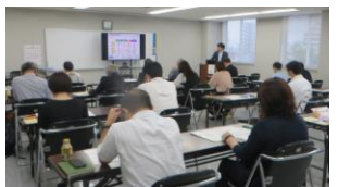
研修会(中小企業施策について)

中小企業組合の制度・運営・会計について専門的な知識を持つ中小企業組合士(組合役員等)の皆様の資質向上を目的として研修会等の事業活動を実施しています。