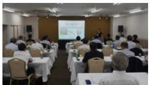
研修会(組合運営の基礎)

県内に事務所を有する中小企業組合の事務局代表者で構成されています。会員の資質向上のための研修会や情報交換、親睦などを通じた「人との出逢い」「ビジネスチャンスとの出逢い」を進めるとともに、組合事務局のスキルアップを目的としています。