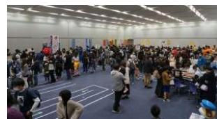
子供を対象にした仕事体験イベント

それぞれの業界を担う若手経営者や後継者等を部員とする組合青年部及び個人会員で組織された、県内最大規模の異業種集団です。次世代リーダーの育成を目指し、研修会や職業体験イベントなど様々な活動を実施しています。