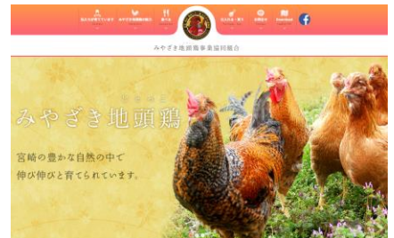
みやざき地頭鶏事業(協)「ホームページ作成」