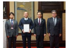
都農町ひょうすんぼ(協)